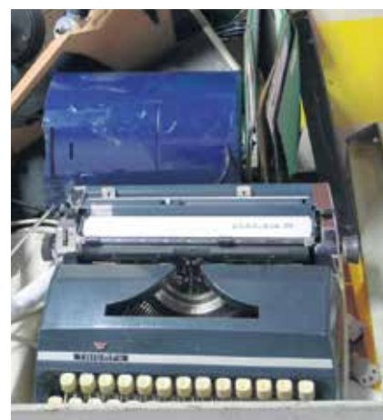
Reif fürs Technikmuseum: eine mechanische Schreibmaschine, gesehen im AfE-Turm kurz vor der Schließung.