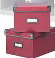
KASSETT Box mit Deckel 5.99/2 St. Lackierte Pappe mit Metall- beschlägen. 27x35 cm, 18 cm hoch. Dunkelrosa 602.242.76