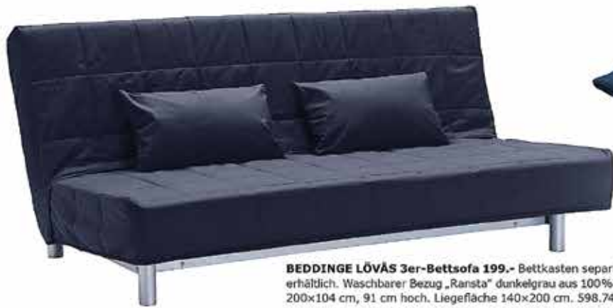
BEDDINGE LÖVÅS 3er-Bettsofa 199.- Bettkasten separat erhältlich. Waschbarer Bezug „Ransta“ dunkelgrau aus 100% Baumwolle. 200x104 cm, 91 cm hoch. Liegefläche 140x200 cm. 598.743.73