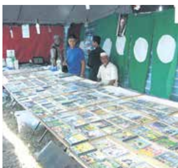
Buchstand bei der Jahres-Generalversammlung der PAS 2010, fotografiert vom Stuhl des Verkäufers aus. Am Rande solcher Veranstaltungen sind stets zahlreiche Verkaufsstände mit islamischen Büchern und DVDs.