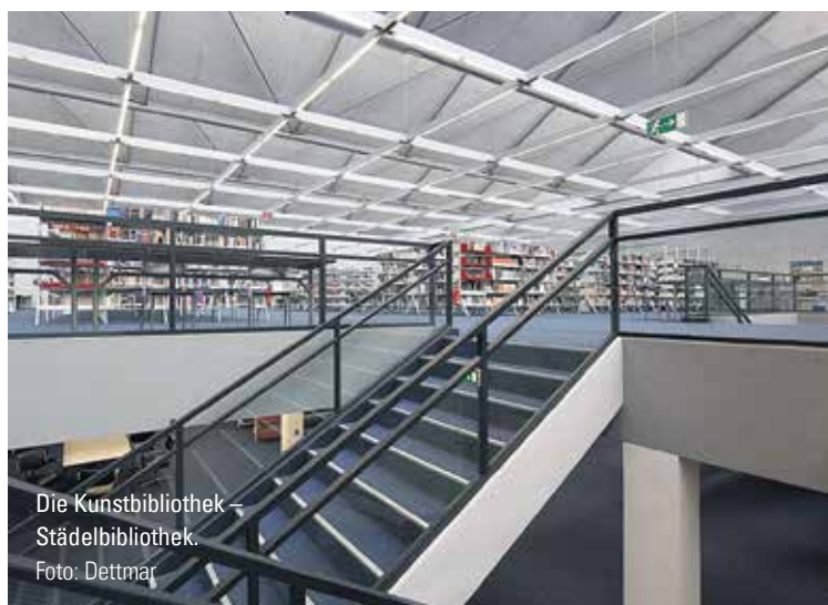
Die Kunstbibliothek = Städelbibliothek.