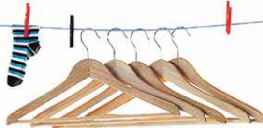
BUMERANG Kleiderbügel 3.49/8 St. Mit Hosenaufhängung. Massives Eukalyptus- holz/Stahl. Naturfarben 401.151.22