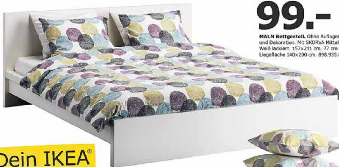
MALM Bettgestell. Ohne Auflagen und Dekoration. Mit SKORVA Mittelbalken. Weiß lackiert. 157x211 cm, 77 cm hoch. Liegefläche 140x200 cm. 898.935.63