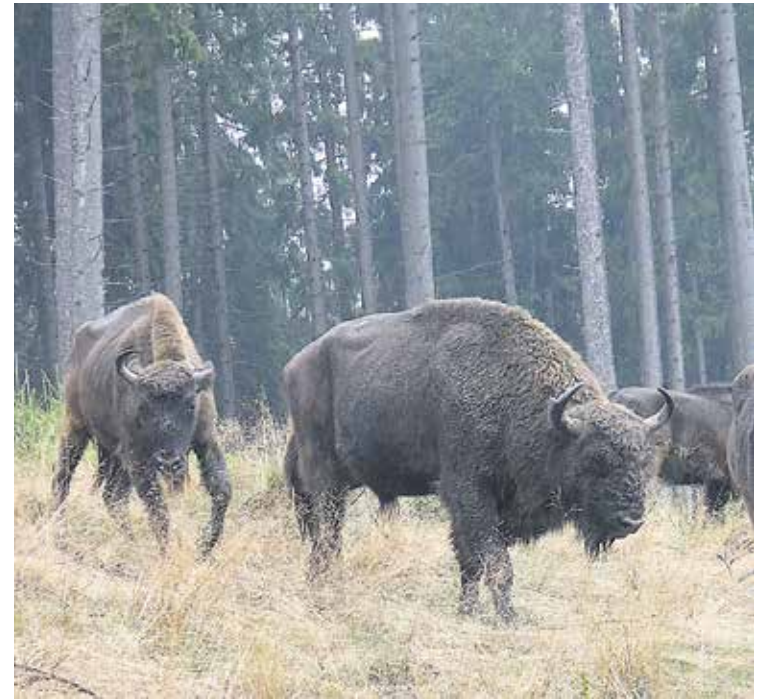
Reagieren mittlerweile recht scheu auf den Menschen: die Wisente im Rothaargebirge.

halten, z. B. mit der Sense, ist sehr aufwändig. Ein großes Weidevieh kann nun eben mit dazu beitragen, diese Wiesen- und Weidenflächen zu erhalten. Wisente sind also gewissermaßen ‚Landschaftspfleger‘“, erläutert Wittig. df