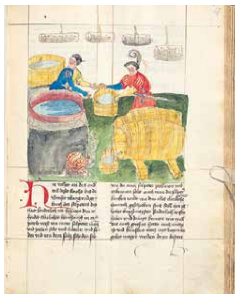
Herstellung von Salpeter, Darstellung aus dem Rüst- und Feuerwerksbuch der Stadt Frankfurt.