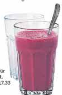
POKAL Glas 0.49/St. Spülmaschinenfest. Auch für warme Getränke geeignet. 35 cl, 14 cm hoch. 800.817.33