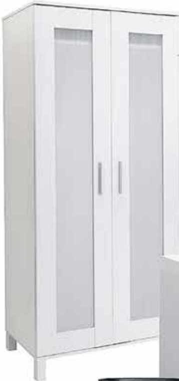
ANEBODA Kleiderschrank. Mit Griffen, 1 Kleiderstange und Einlegeboden. 81x50 cm, 180 cm hoch. Weiß 901.217.62