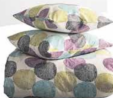
MALIN RUND Bettwäsche-Set. 100% Baumwolle. 140x200/80x80 cm. Bunt 102.249.24