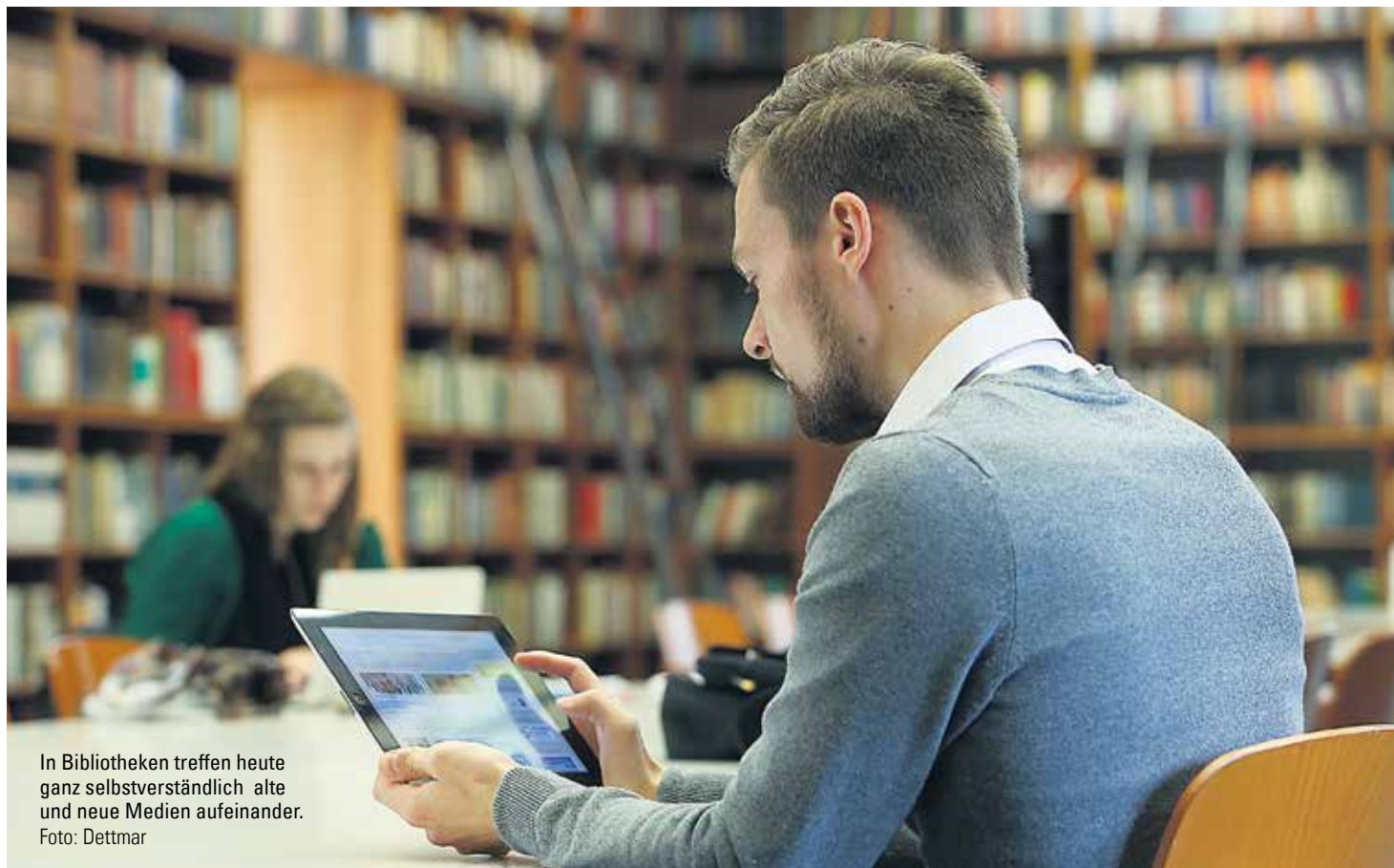
In Bibliotheken treffen heute ganz selbstverständlich alte und neue Medien aufeinander.