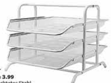
DOKUMENT Briefablage 3.99 Pulverbeschichteter Stahl. 29x35 cm, 25 cm hoch. Silberfarben 601.532.50