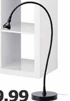
JANSJÖ Arbeitsleuchte. Verstellbarer Arm. Stahl/ Aluminium. 60 cm hoch. Fuß Ø 12 cm. Schwarz 501.632.02