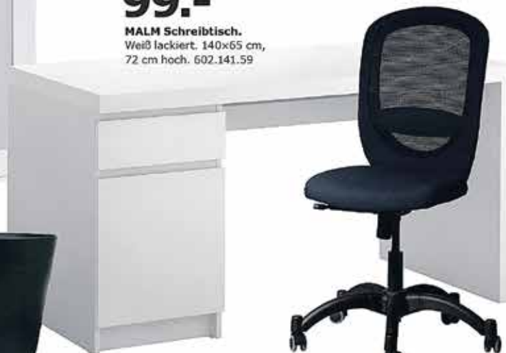
VILGOT Drehstuhl 59.- Bezug aus 100% Polyester. Sitzfläche 47x48 cm, höhenverstellbar 47-60 cm. Schwarz 601.931.85