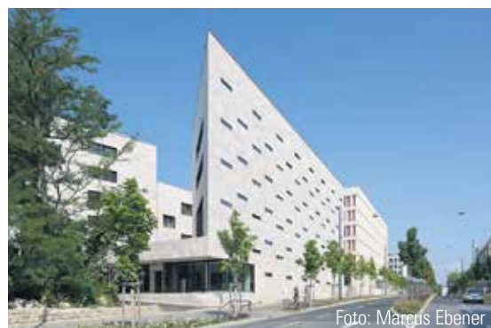
Eingang des Instituts in der Frankfurter Hansaallee.

Integration und Europa, der Neubau des Instituts eingeweiht. Neben Arbeitsplätzen und Gästewohnungen für die Wissenschaft beherbergt der Neubau auch eine Bibliothek, die schon heute weltweit zu den wichtigsten Spezialbibliotheken für Rechtsgeschichte zählt. UR