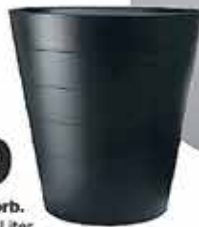
FNISS Papierkorb. Polypropylen. 14 Liter, 30 cm hoch. Schwarz 100.964.17